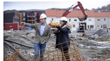
Bråbrems endrer boligtypene