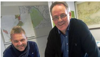
Stor respons på nytt boligprosjekt i Sandnes