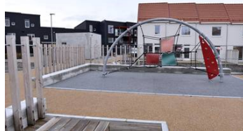
Unge vil ha kvalitet, trenger ikke store boliger